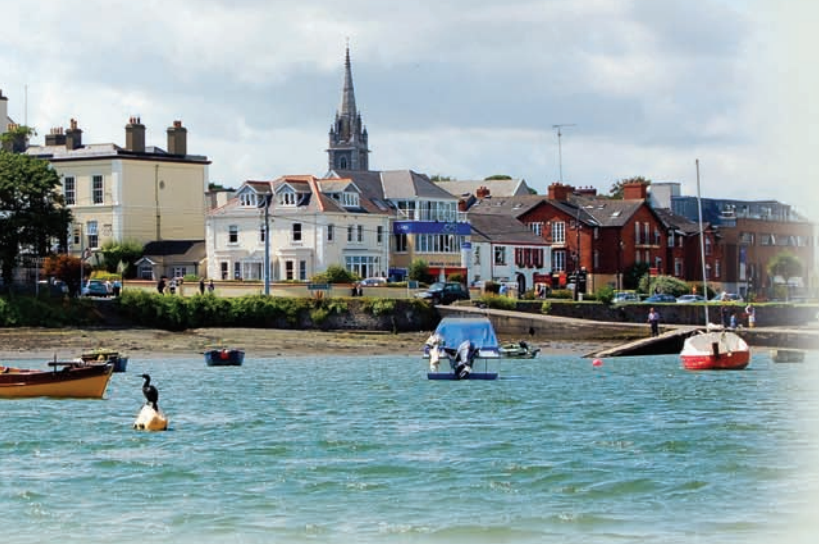
Malahide, ein wunderschöner Ort, gelegen an Dublins Küste (10 min. bis zum Flughafen, 20 min. bis zum Stadtzentrum Dublins)

Wir sind sehr stolz darauf, eine freundliche Schule zu sein, in der wir individuellen Anforderungen gerecht werden können und jeder Schüler sich willkommen fühlt. Unsere hervorragenden Einschätzungen der Schüler bestätigen dies. Anerkannt vom Bildungsministerium als eine Schule zum Lehren von Englisch als Fremdsprache, haben wir unseren Ruf auf ausgezeichnetem Unterricht, beispielloser Freundlichkeit und dem Bewusstsein für die Bedürfnisse der Schüler, aufgebaut. Unsere Lehrer sind hochqualifiziert und engagiert Unterricht der Höchstklasse zu vermitteln. Der sehr gute Abschluss der Cambridge-Prüfungen unserer Schüler bestätigt, dass unser Unterricht den höchsten Standards entspricht. Unsere modernen Einrichtungen verfügen über kostenlosen Internetzugang, W-LAN-Zugang, einen Lernbereich und eine Bibliothek. Desweiteren verfügen wir über eine Räumlichkeit, in der Schüler sich erholen, andere Schüler treffen und den sozialen Aspekt unserer Schule genießen können.