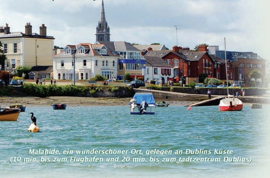
Malahide, ein wunderschöner Ort, gelegen an Dublins Küste (10 min. bis zum Flughafen und 20 min. bis zum Stadtzentrum Dublins)

Das Jugendprogramm wurde sorgfältig entwickelt, um zu gewährleisten, dass die Schüler viel von diesem bereichernden Programm mitnehmen. Die Schüler werden ein natürliches Interesse entwickeln, ihr Englisch in dieser lebendigen und freundlichen Umgebung zu verbessern. Das Feedback unserer Schüler ist ausgezeichnet und wir bemühen uns weiterhin, unsere Sommer zum Höhepunkt des Jahres zu machen.