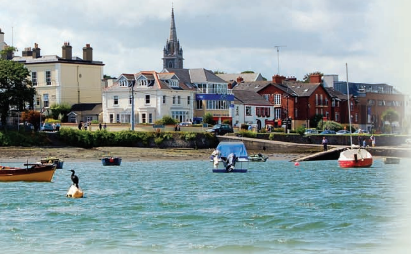
Malahide, une ville côtière de Dublin parfaitement bien située (à 10 minutes de l'aéroport de Dublin, et 20 minutes du centre ville de Dublin)

Les excellents résultats de nos étudiants à l'examen du Cambridge témoignent du niveau de notre enseignement. Nos équipements modernes comprennent l'accès libre à internet, l'utilisation du Wifi, des salles d'études disponibles pour les étudiants ainsi qu'une bibliothèque. Les étudiants disposent également d'une salle commune où ils peuvent se détendre, rencontrer d'autres étudiants et apprécier ainsi le côté accueillant de l'école.