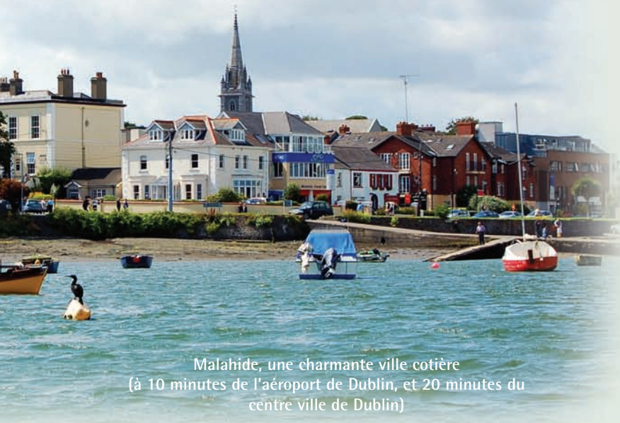
Malahide, une charmante ville côtière (à 10 minutes de l'aéroport de Dublin, et 20 minutes du centre ville de Dublin)

Le programme pour les juniors a été soigneusement créé pour que les étudiants puissent entièrement tirer profit de leur séjour. Les étudiants trouveront un intérêt personnel naturel à améliorer leur anglais, dans un environnement chaleureux et amusant. Les témoignages de nos étudiants sont excellents, et nous nous efforçons de faire de leur été un moment inoubliable.